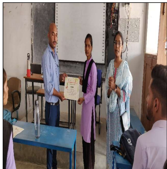
Certificate Distribution of Essay Competition