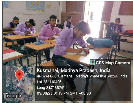
Essay Writing Competition