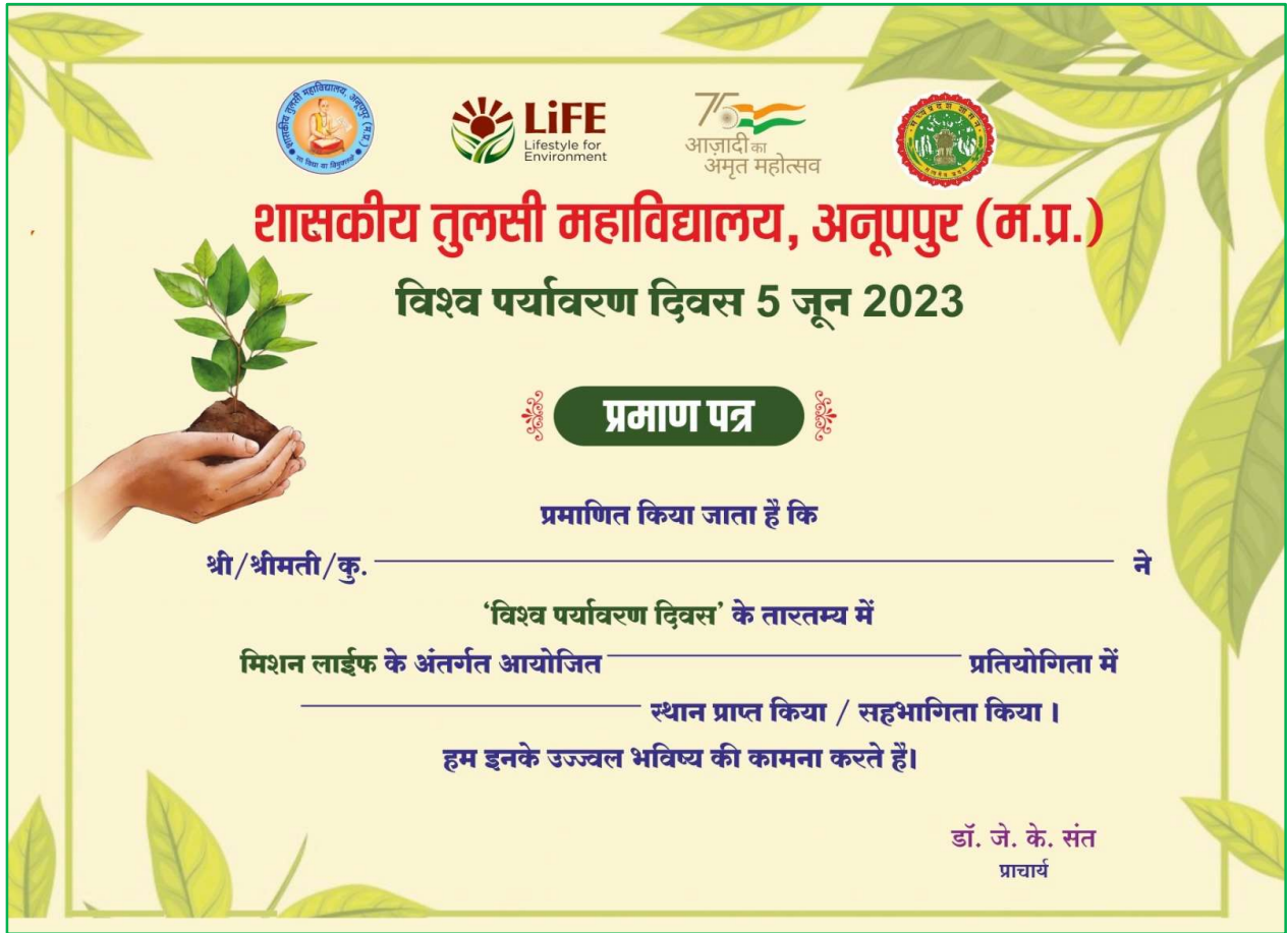
Certificate of Essay Competition